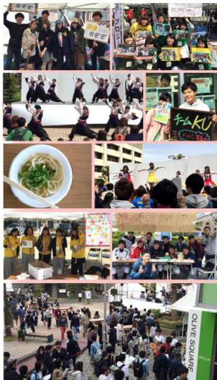
賑やかな幸町キャンパス

幸町キャンパスで2日間にわたり、新入生歓迎祭が行われました。在学生によるサークル紹介や、様々なパフォーマンスが繰り広げられ、大いに盛り上がりました。また、6日のお昼には、香川名物のうどんが振る舞われました。