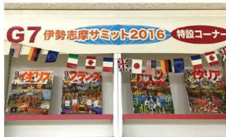
4月末まで特設コーナーで展示

5月に開催される伊勢志摩サミットに先立ち、「情報通信大臣会合」が高松市かがわ国際会議場で4月29日と30日に開催されます。図書館中央館においても、サミット応援企画展として、サミットの歴史、情報通信関連の書籍の紹介を行っています。