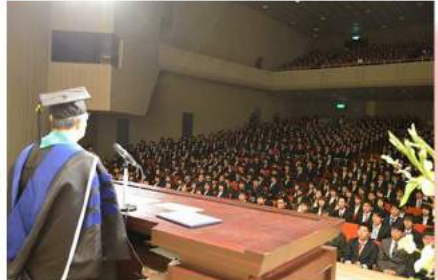
学部入学式の様子

香川大学幸町キャンパスにおいて、平成28年度入学式を執り行いました。真新しいスーツ姿の新入生は、やや緊張した面持ちで、これからはじまる大学生活への期待を胸に、学長や在学生代表のお祝いの言葉に耳を傾けていました。